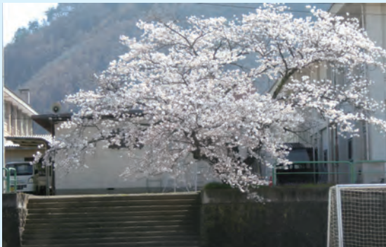
校庭西側より校舎の桜をのぞむ

発行/長野県松代高等学校同窓会 責任者/細川隆男 〒381-1232 長野県長野市松代町西条 4065 TEL 026-278-2044 (代) FAX 026-278-2070 http://matsudou.com/ 編集・印刷 同窓会事務局 〒121-0831 東京都足立区舎人 3-11-26EPS TEL 03-5839-3456 (代) FAX 03-5839-3460