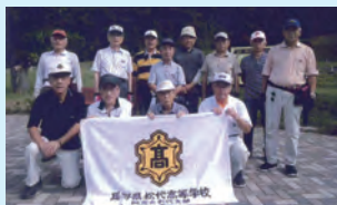
松代支部マレットゴルフ親睦会