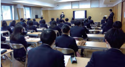
令和5年度 進路中間報告 12月1日現在

同窓会よりご支援いただいている「松濤塾」に関しては、土日の模擬試験をはじめとして進路実現に向けて大いに活用させていただいています。今後も松代高校生の学びのために同窓生の皆様にはご支援、お力添えをよろしくお願いいたします。