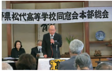
令和5年度の同窓会総会が6月3日(土)に松代町の梅田屋で開催されました。この間、新型コロナウイルス感染症流行のため令和2年度から昨年度までの3年間は、役員総会のよ

うな形で総会を行いました。本年の総会は、新型コロナウイルスの5類への移行を受け、日常生活の自粛がとられたことから、通常開催となりました。