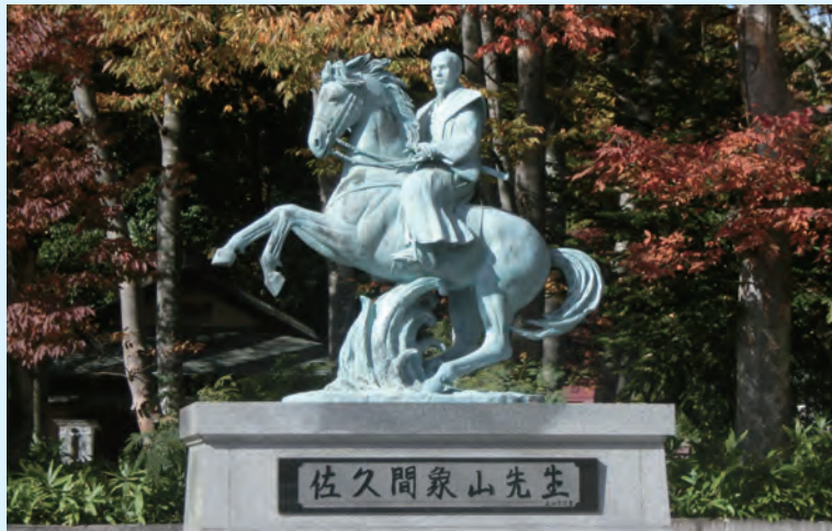
象山神社前象山先生像